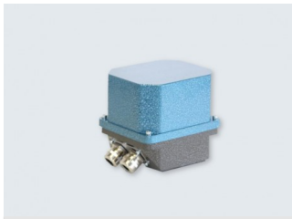
Serie 00-15 ≤12Nm Stellantriebe