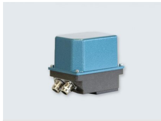
Serie 01-15 ≤20Nm Stellantriebe