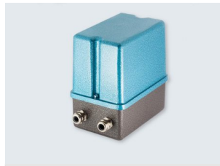
Serie 02-50 ≤60Nm Stellantriebe