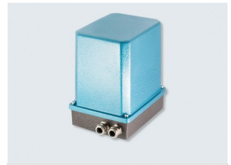
Serie 03-120 ≤180Nm Stellantriebe