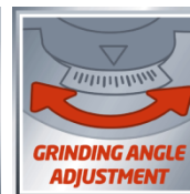
GRINDING ANGLE ADJUSTMENT