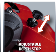
ADJUSTABLE DEPTH STOP