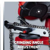
GRINDING ANGLE ADJUSTMENT