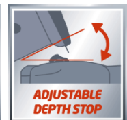
ADJUSTABLE DEPTH STOP